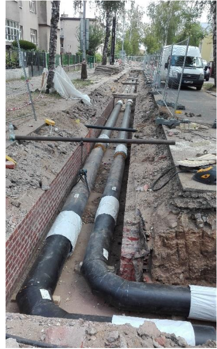
pára nahrazena teplovodem